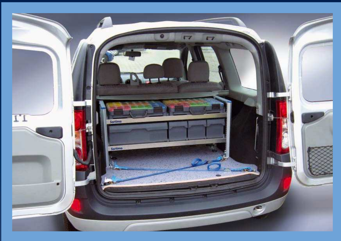
Dacia Logan MCV z zabudową Sortimo